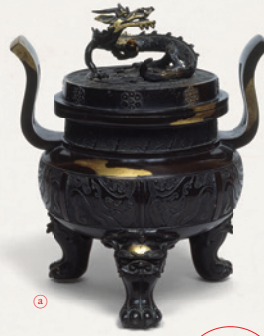
重要文化財 全十六幅 一季公開