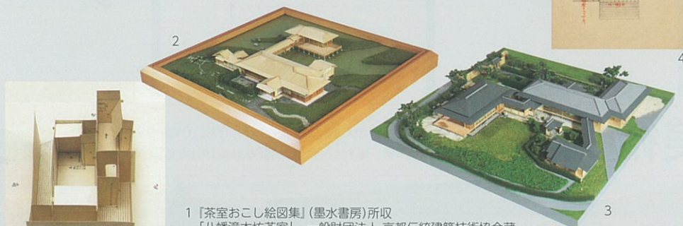
1 「茶室おこし絵図集」(墨水書房)所収 「八幡瀧本坊茶室」 一般財団法人 京都伝統建築技術協会蔵 2 白鳥公園茶室清羽亭(名古屋)模型 日本建築専門学校 伝統建築研究所蔵 3 花フェスタ記念公園茶室(可児市)模型 日本建築専門学校 伝統建築研究所蔵 4 「八幡山瀧本坊珍蔵録」所収「大有宗甫数寄屋圖」 松花堂美術館蔵