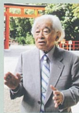
なかむら まさお 中村昌生 (1927~2018)

作品例 もみじ公園清風荘茶室宝紅庵(山形市、昭和55年) 大濠公園日本庭園茶会館(福岡市、昭和59年) 新宿苑茶亭(東京都、昭和62年) 山寺芭蕉記念館(山形市、平成元年) 花博日本庭園茶室むらさき亭(大阪市、平成2年) スウェーデン国立民族博物館茶室 瑞暉亭(ストックホルム、平成2年) 酒田市出羽遊心館(酒田市、平成6年) 兼六園時雨亭(金沢市、平成12年) ギメ美術館茶室(パリ、平成13年) 越前古窯博物館茶室(越前町、平成29年) など多数